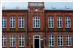
Aussenansicht des historischen Gebäudes der Bauschule in Eckernförde.