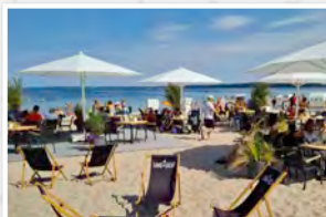
Zur Strandbar oder zu unserem Brauhaus ist es nicht weit. „Pause“ oder „Weiterfeiern“ - alles ist möglich.