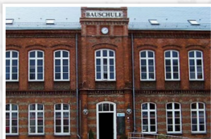
Aussenansicht des historischen Gebäudes der Bauschule in Eckernförde.