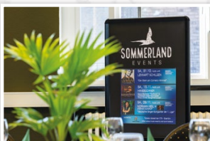
Für Veranstaltungen aller Art einsatzbereit. Für Feiern, Tagungen, Seminare und vieles mehr.