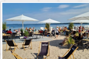
Zur Strandbar oder zu unserem Brauhaus ist es nicht weit. „Pause“ oder „Weiterfeiern“ - alles ist möglich.